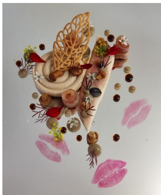
LES TABLES GOURMANDES DU BERRY 2021

Concours ouvert aux résidents de la région, le grand gagnant sera exposé aux côtés de l'exposition officielle du F.I.P.C. au Château de Valençay, dont le vernissage est prévu le 17 décembre 2021, avec une délibération interne aux associations qui participent à l'opération Automne Gourmand en Région Centre Val de Loire, le 13 décembre.